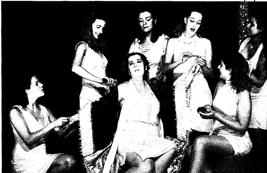
Honeggers opera is meer 'farce en musique' dan opéra buffo